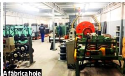
A fábrica hoje