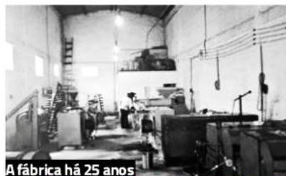
A fábrica há 25 anos