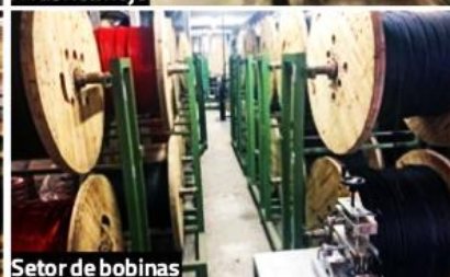
Setor de bobinas

Jimi. É um cabo ao qual dedicamos mais de um ano de pesquisas, desenvolvimento e novo maquinário, para manter nosso padrão. Será realmente um produto com o qual os músicos irão se identificar e nossos parceiros podem ter a certeza de um giro imediato em suas lojas, garantindo nossa qualidade e mais uma excelente opção em seu mix. ■