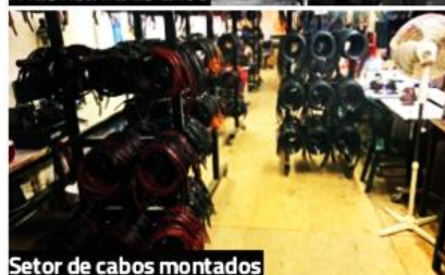
Setor de cabos montados